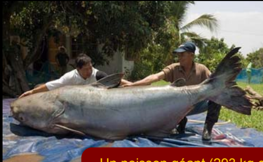
Un poisson géant (293 kg et 2,7m)

Il prend le nom chinois de LanCang Jiang (Fleuve tumultueux) (Lan Trường Giang en vietnamien) au sortir des grottes de Yunnan (Vân Nam). C'est dans cette région montagneuse et luxuriante de la Chine qu'on trouve non seulement une variété exceptionnelle de paysages mais aussi un bouillon de cultures et une mosaïque de minorités ethniques. (26 sur 57 groupes ethniques que possède la Chine). Malgré plus d'un demi-siècle de régime