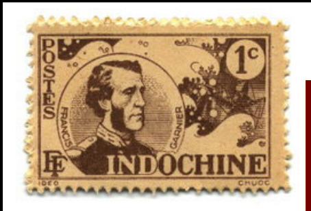
Doudard de Lagrée

Sans l'intervention de ces Youn, le Cambodge peut-il retrouver un havre de paix comme il l'a aujourd'hui? Est-il possible d'entretenir cette haine séculaire et viscérale lorsqu'on sait que les Khmers et les Vietnamiens ont besoin de la paix et de la fraternité après tant d'années de souffrances et de guerres? Il ne faut pas se laisser gangrener par le nationalisme et la xénophobie exécrationnelle mais il faut savoir tourner la page d'histoire pour regarder l'avenir qui appartient à ceux qui savent le construire à l'image des Européens (franco-allemands)