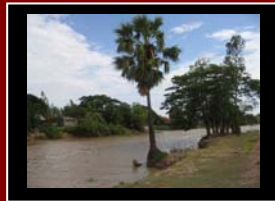
Canal Vinh Tế ( Châu Đốc )

La domestication du Mékong donne l'occasion à ces états de gérer ensemble ses ressources. Le poids des héritages, les écarts économiques et socioculturels entre les populations riveraines ne facilitent pas cette coopération. La démographie galopante du bassin (prévision de 100 millions d'habitants en 2025) risquant d'accélérer l'agonie de ce fleuve, n'est pas étrangère non plus à la déforestation et au défrichement qui sont aussi l'un des facteurs responsables des inondations et des crues constatées fréquemment dans le bassin depuis 1990. Ces facteurs ne laissent qu'à ces états une marge de manoeuvre très étroite. C'est à eux de prendre conscience de cette réalité car leurs destinées semblent liées étroitement à l'avenir de ce fleuve. Malgré cela, il faut garder un certain optimisme à l'image du natif du Mékong dans l'espoir de retrouver un jour, le fleuve mythique reprendre son long cours tranquille.