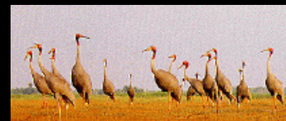
Grues à tête rouge (Trầm Chim, Đồng Tháp Mười )