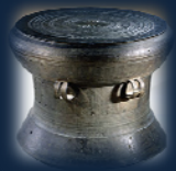
Tambour de bronze de Dong Son