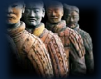
Armée de Tsin en terre cuite