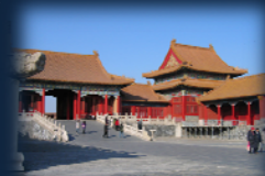
Cité interdite de Pékin

Việt-Nam mon pays natal. Terre des dragons et des légendes.