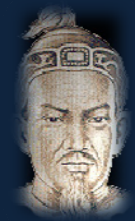
Hùng Đạo Vương